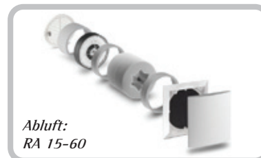
Abluft: RA 15-60