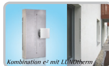
Kombination e 2 mit LUNOtherm