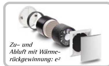
Zu- und Abluft mit Wärmerückgewinnung: e 2