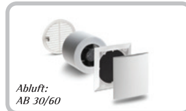
Abluft: AB 30/60