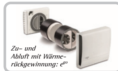
Zu- und Abluft mit Wärmerückgewinnung: e 90