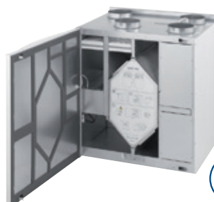
Save VTC 300 Wohnungslüftungsgerät mit Rotationswärmetauscher