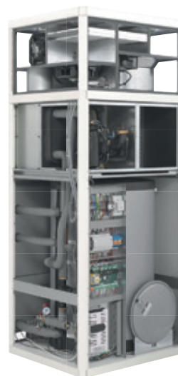
Genius Haustechnikzentrale zum Heizen, Kühlen und Warmwasserbereitung